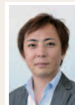
セミナー講師 ※講師は変更になる場合がございます。