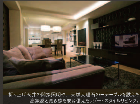
折り上げ天井の間接照明や、天然大理石のテーブルを設えた高級感と癒し感を兼ね備えたリゾートスタイルリビング。